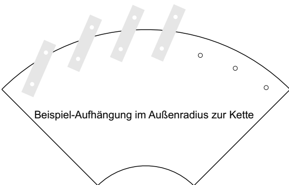
Beispiel-Aufhängung im Außenradius zur Kette

Andere Maße nach Ihren Vorgaben möglich.